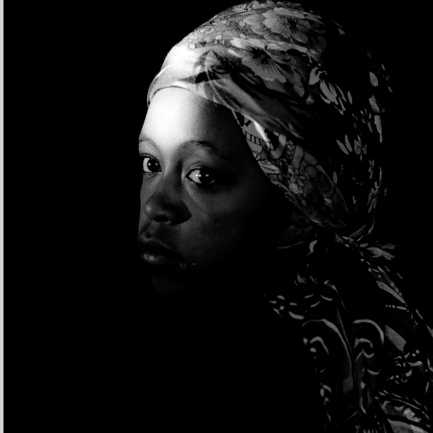
„Long way home“ © Robert Helgerth